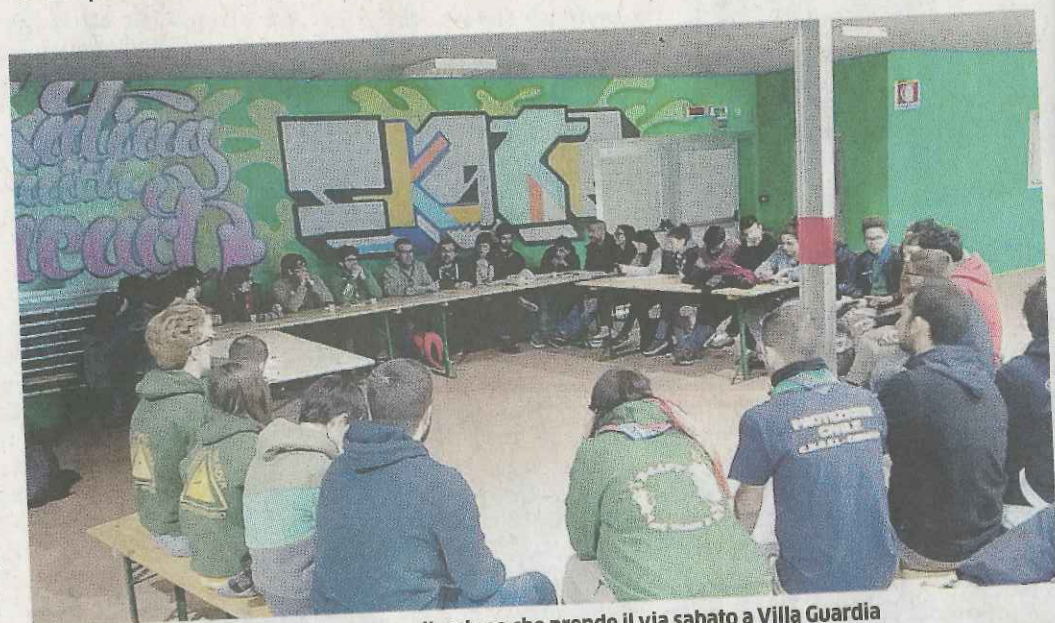
Un gruppo di scout riunito per preparare il raduno che prende il via sabato a Villa Guardia

In origine la macchina organizzativa, guidata dal commis-